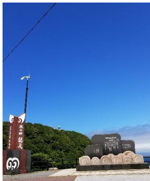
(津軽鉄道終点 三厩駅(みんな))