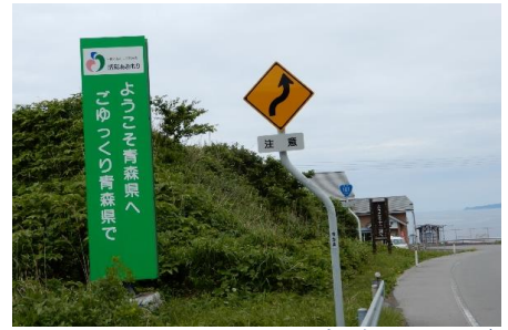
(6月16日 10時45分青森県突入)

3日間は肌寒く小雨も降ったり止んだり、やっと 晴れても風が強く相棒の麦わら帽子はお留守番 でした。