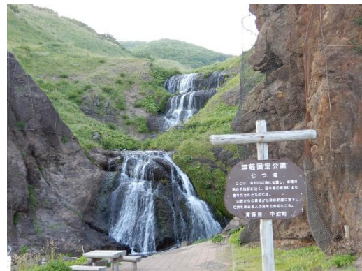
339 号線竜伯ライン物凄い濃霧を野猿に脅されながらシャッターを切る