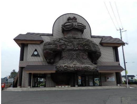
五能線 木造駅の遮光器土偶